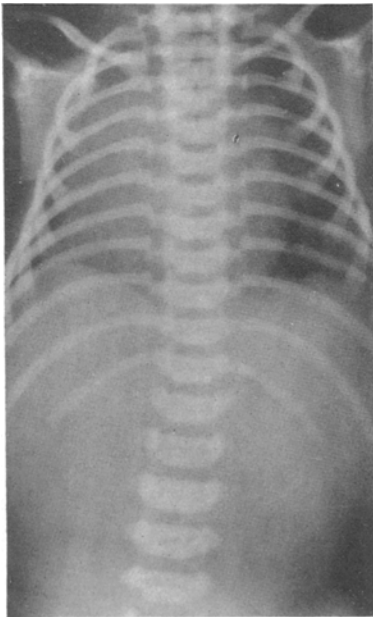
Abb. 3. Röntgenbild eines Lebendgeborenen. Lungen luftfüllig. Keine Luft in Magen und Darm.