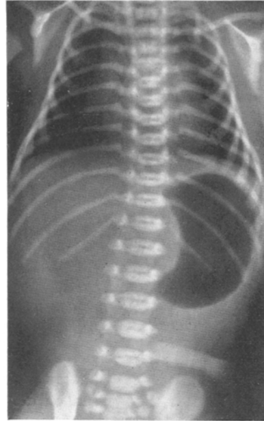
Abb. 2. Röntgenbild eines Totgeborenen nach Einblasen von Luft in Trachea und Oeso- phagus.